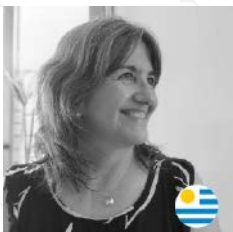
BM&Asoc. Beatriz Martínez